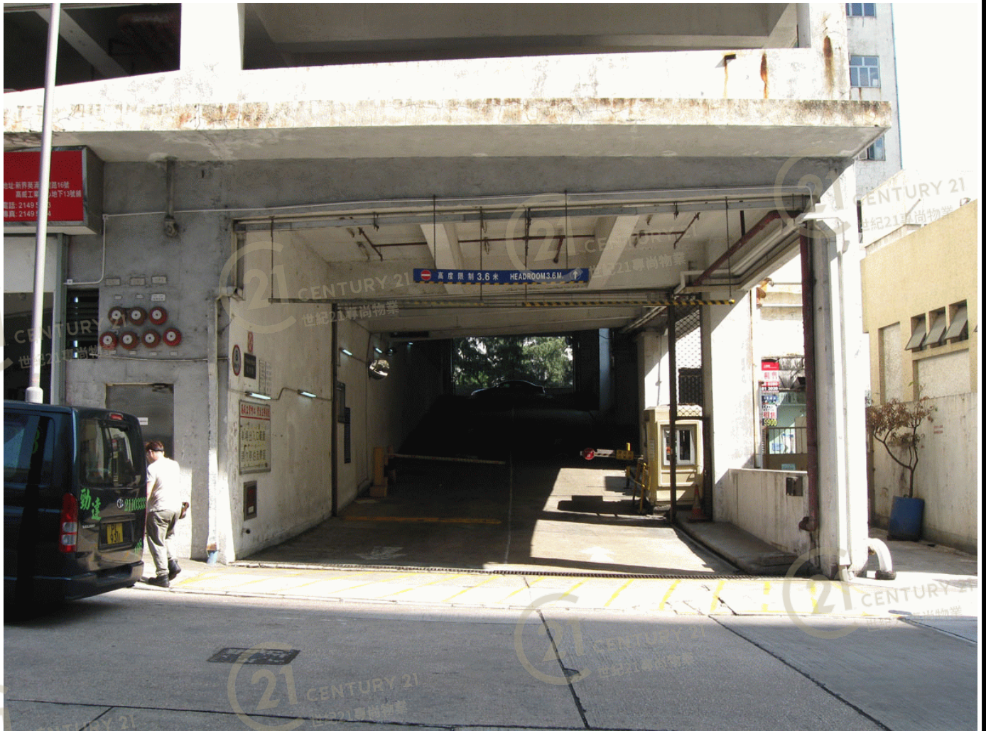
高威工業中心B座 Gold Way Industrial Centre Block B

NOT TO SCALE, FOR IDENTIFICATION PURPOSE ONLY