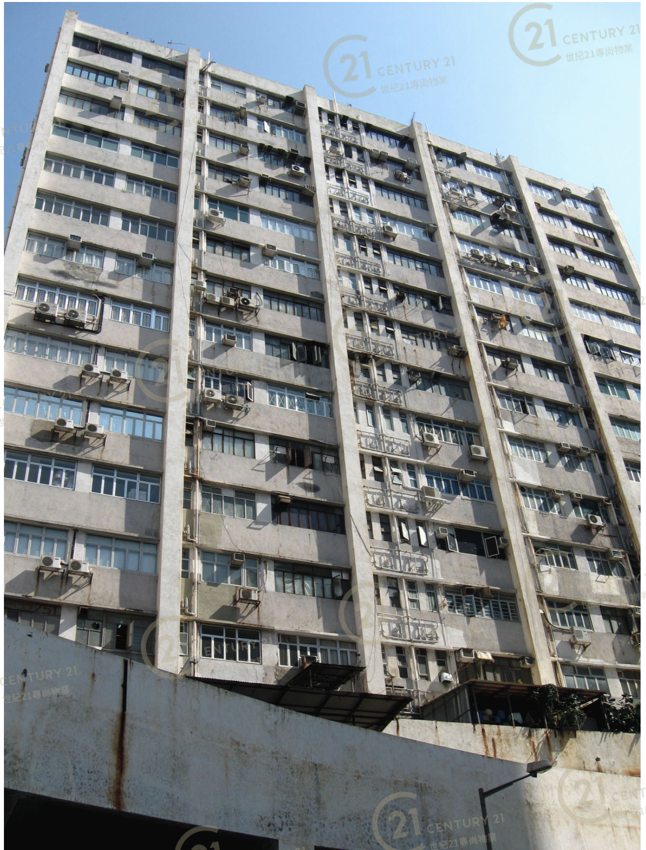
高威工業中心B座 Gold Way Industrial Centre Block B

NOT TO SCALE, FOR IDENTIFICATION PURPOSE ONLY