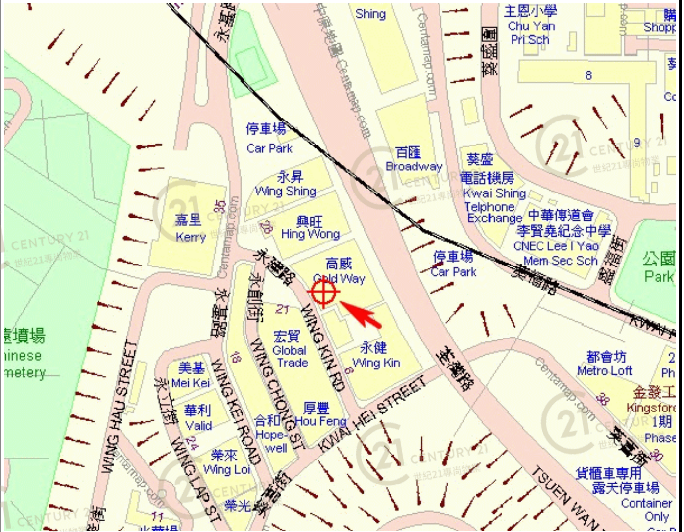
高威工業中心B座 Gold Way Industrial Centre Block B

NOT TO SCALE, FOR IDENTIFICATION PURPOSE ONLY