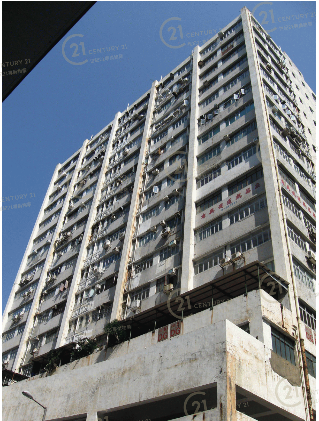
高威工業中心B座 Gold Way Industrial Centre Block B

NOT TO SCALE, FOR IDENTIFICATION PURPOSE ONLY