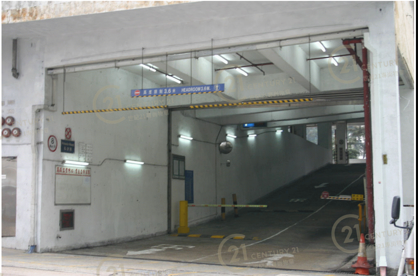
高威工業中心B座 Gold Way Industrial Centre Block B

NOT TO SCALE, FOR IDENTIFICATION PURPOSE ONLY