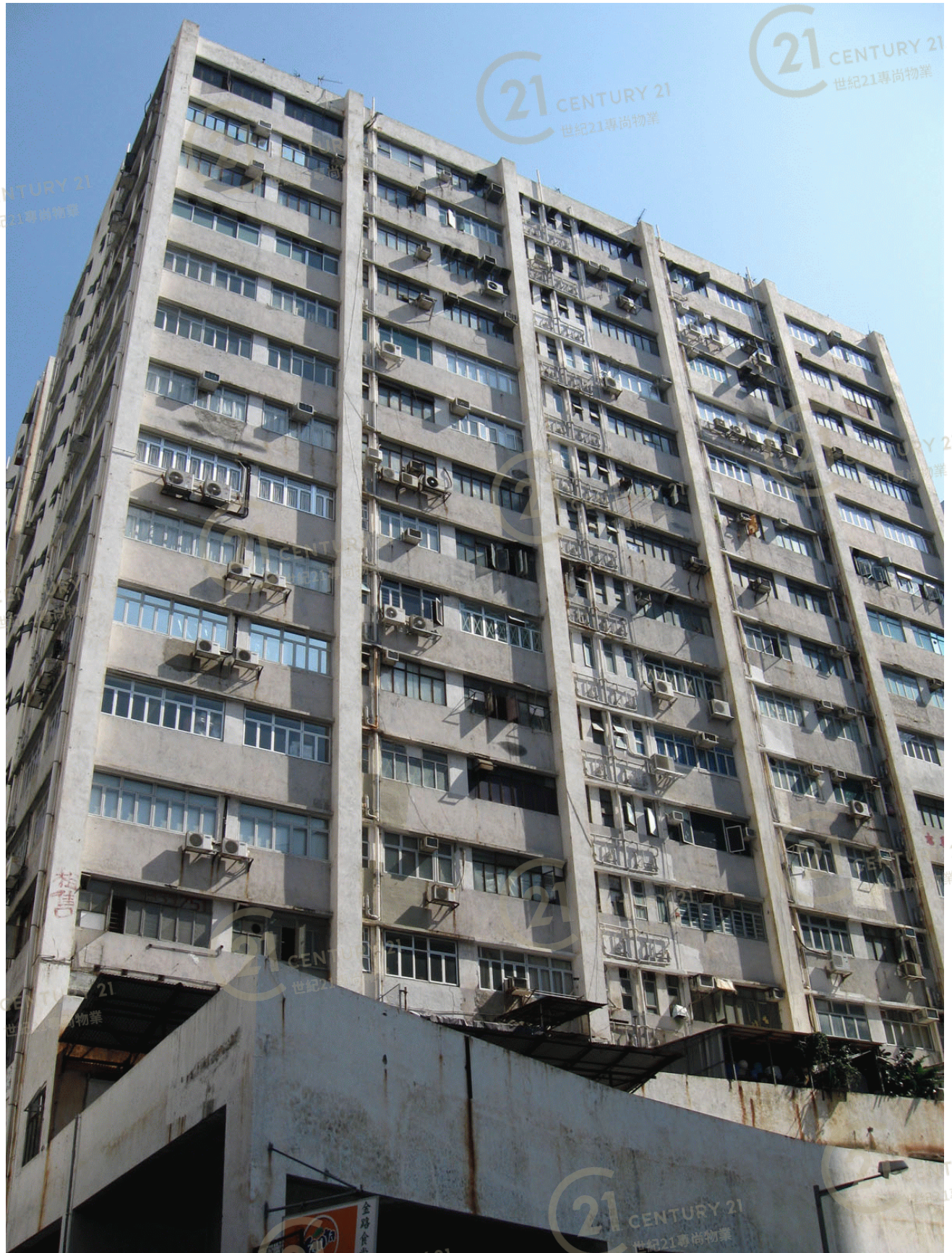
高威工業中心B座 Gold Way Industrial Centre Block B

NOT TO SCALE, FOR IDENTIFICATION PURPOSE ONLY