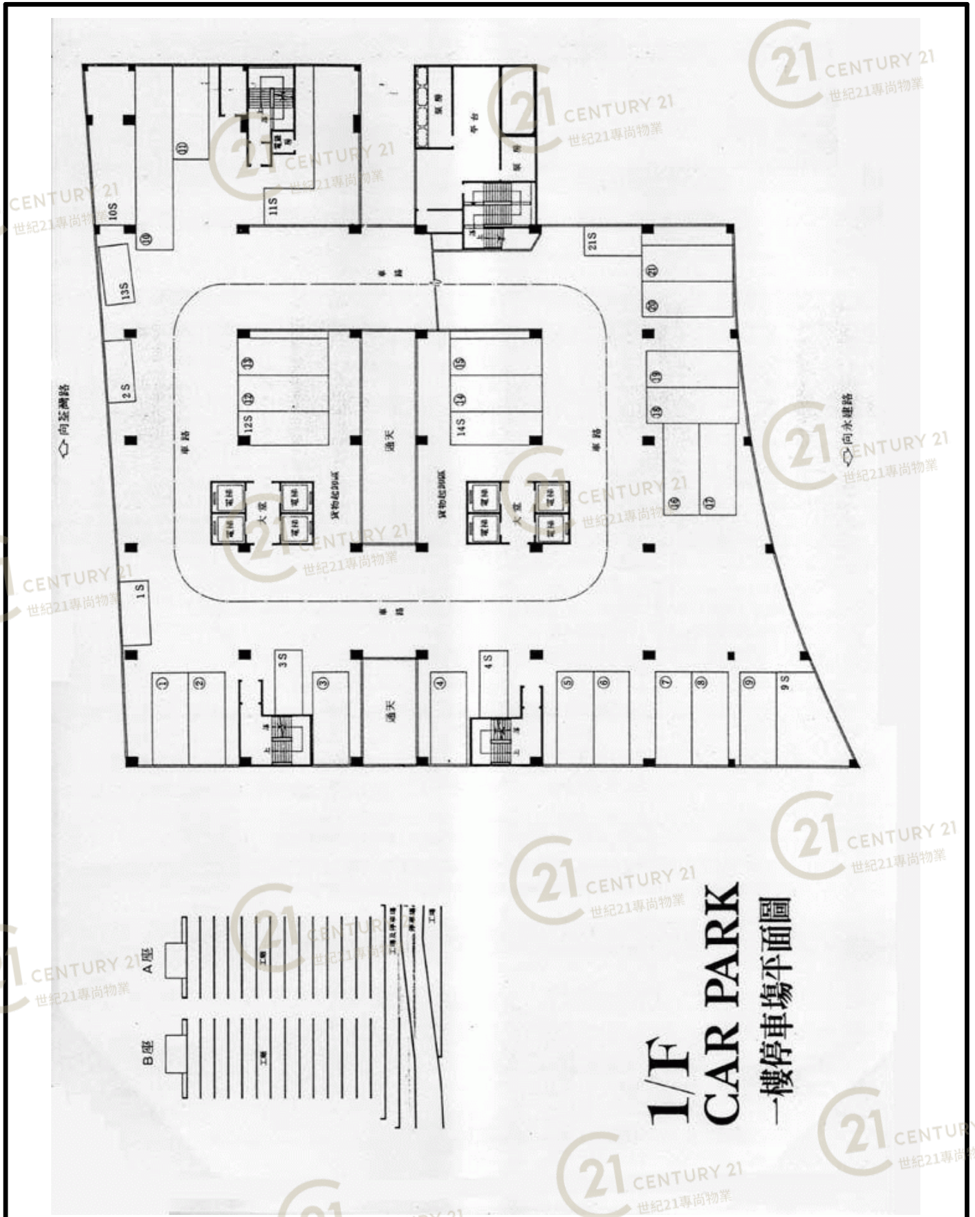
高威工業中心B座 Gold Way Industrial Centre Block B

NOT TO SCALE, FOR IDENTIFICATION PURPOSE ONLY