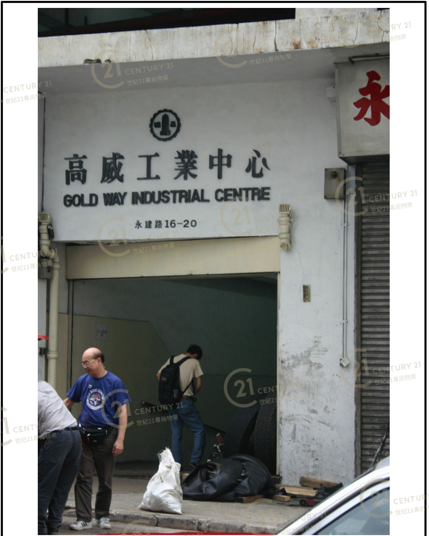
高威工業中心B座 Gold Way Industrial Centre Block B

NOT TO SCALE, FOR IDENTIFICATION PURPOSE ONLY