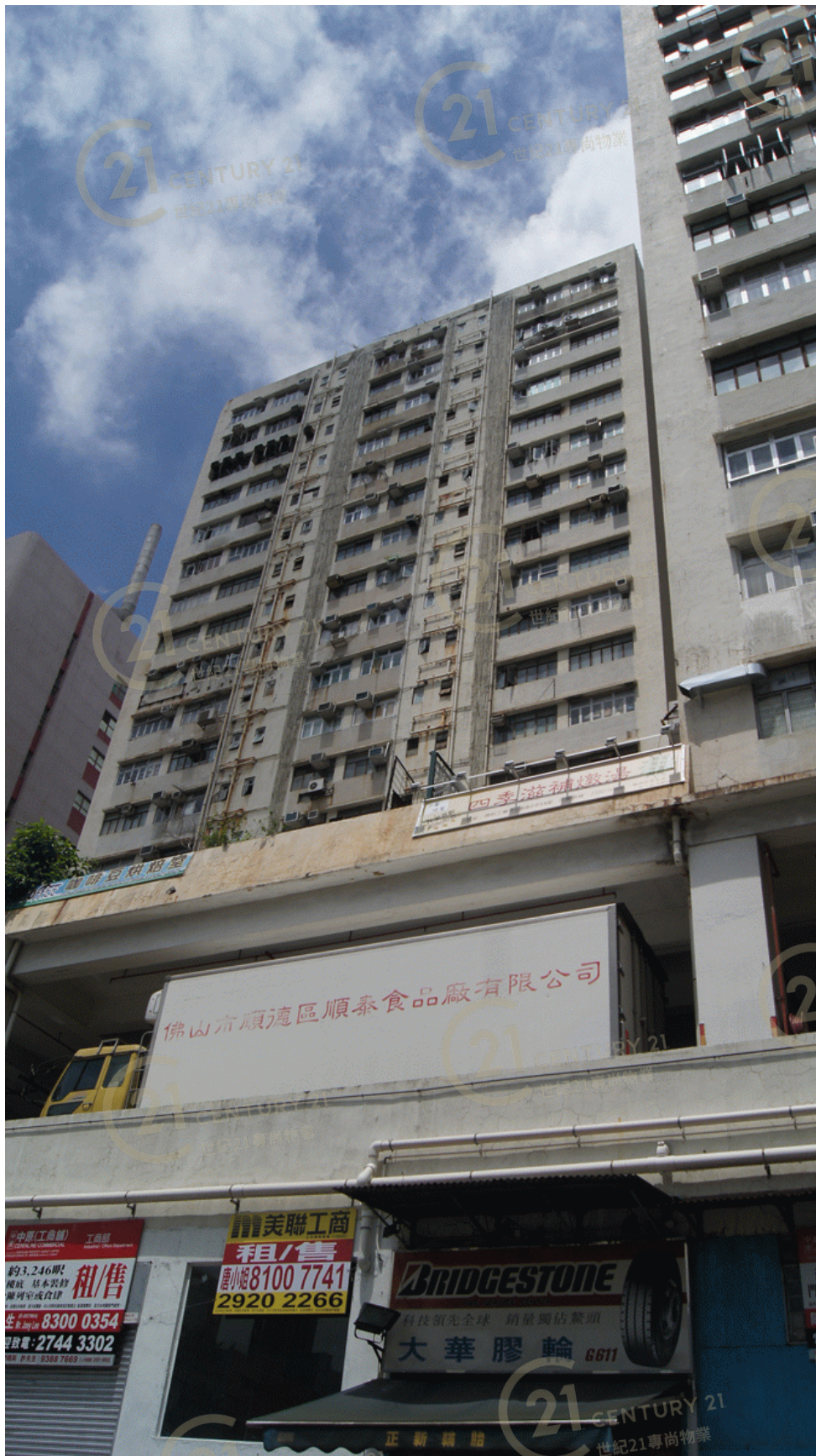
得利工業中心A座 Tak Lee Industrial Centre A

NOT TO SCALE, FOR IDENTIFICATION PURPOSE ONLY