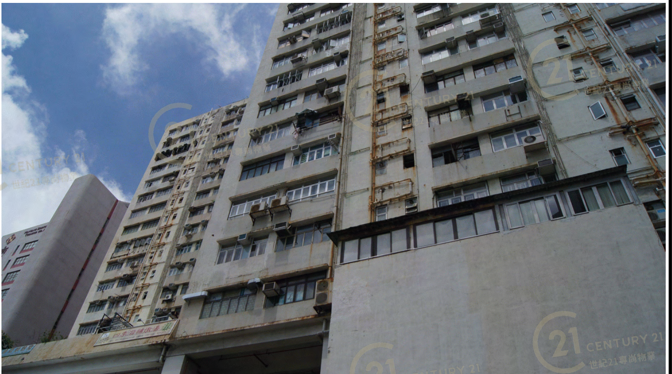
得利工業中心A座 Tak Lee Industrial Centre A

NOT TO SCALE, FOR IDENTIFICATION PURPOSE ONLY