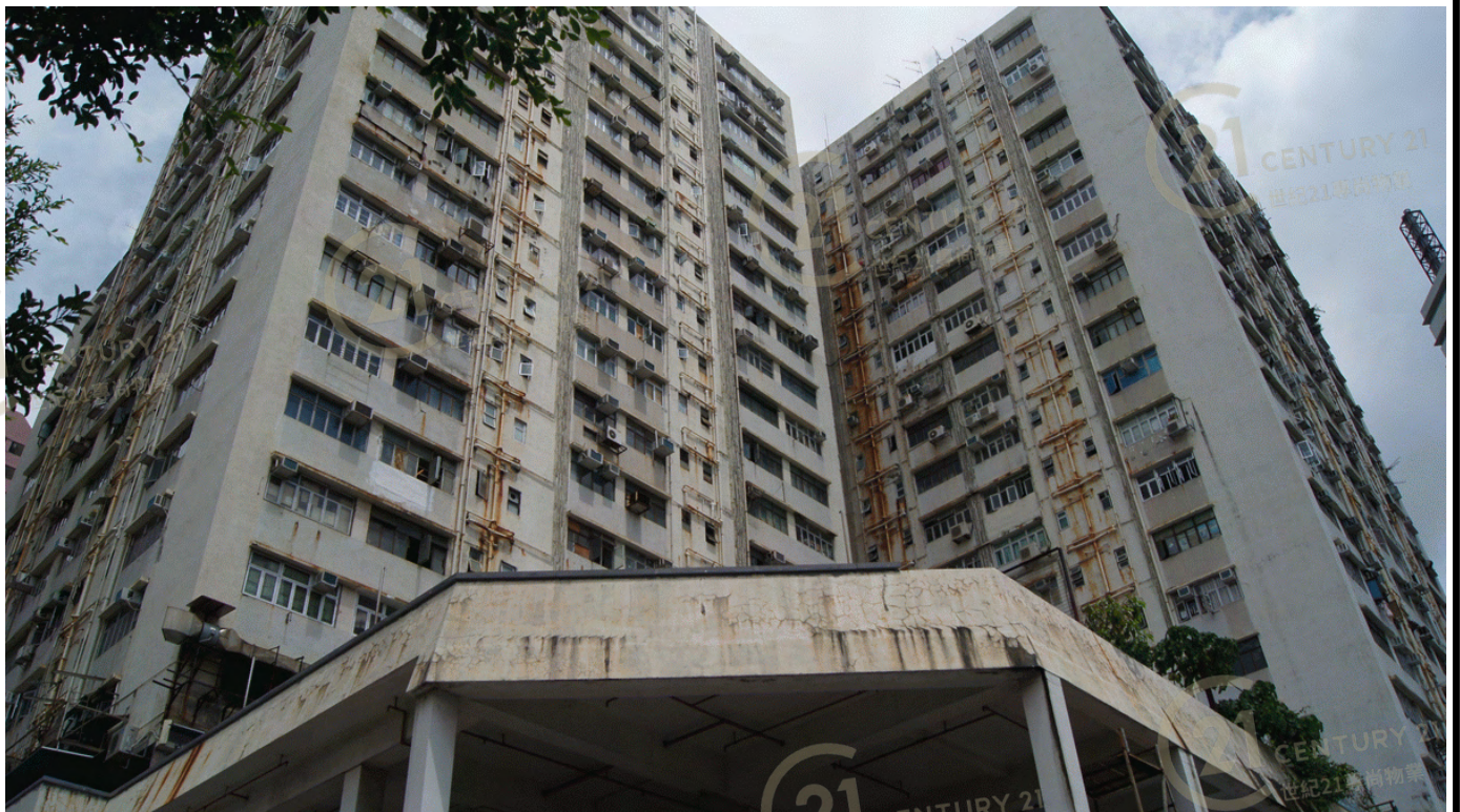
得利工業中心A座 Tak Lee Industrial Centre A

NOT TO SCALE, FOR IDENTIFICATION PURPOSE ONLY