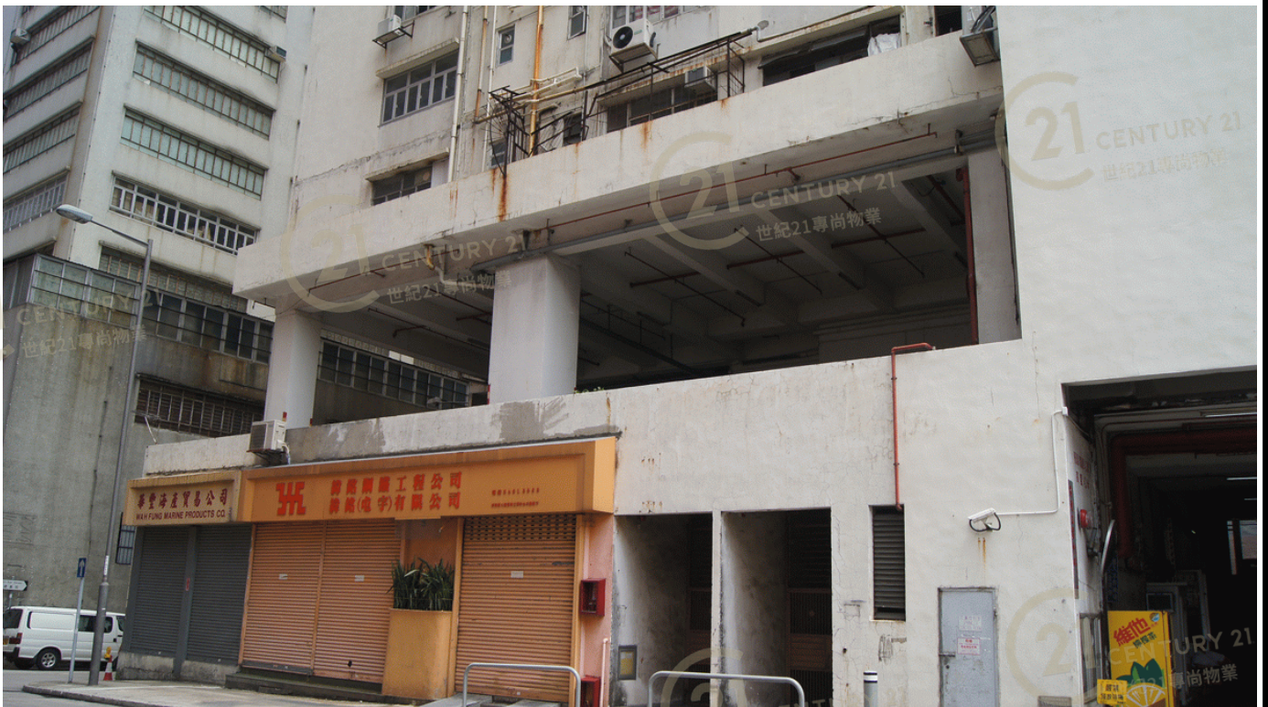
得利工業中心A座 Tak Lee Industrial Centre A

NOT TO SCALE, FOR IDENTIFICATION PURPOSE ONLY