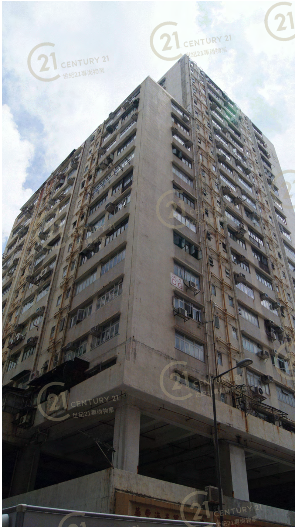
得利工業中心A座 Tak Lee Industrial Centre A

NOT TO SCALE, FOR IDENTIFICATION PURPOSE ONLY