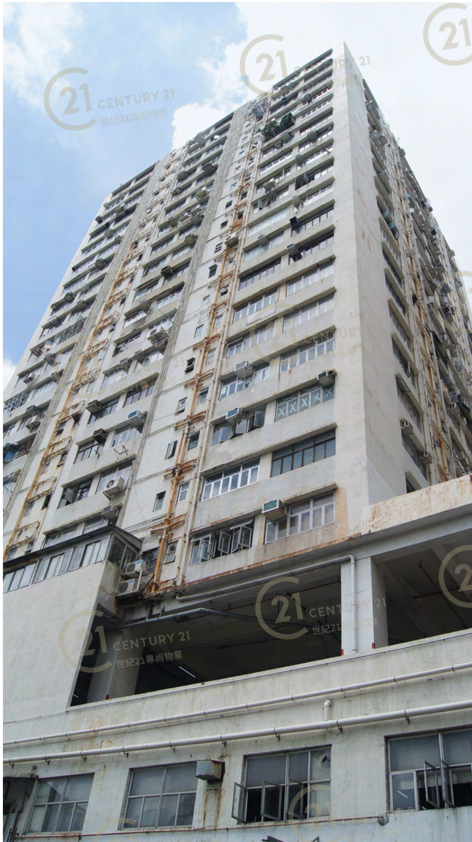
得利工業中心A座 Tak Lee Industrial Centre A

NOT TO SCALE, FOR IDENTIFICATION PURPOSE ONLY