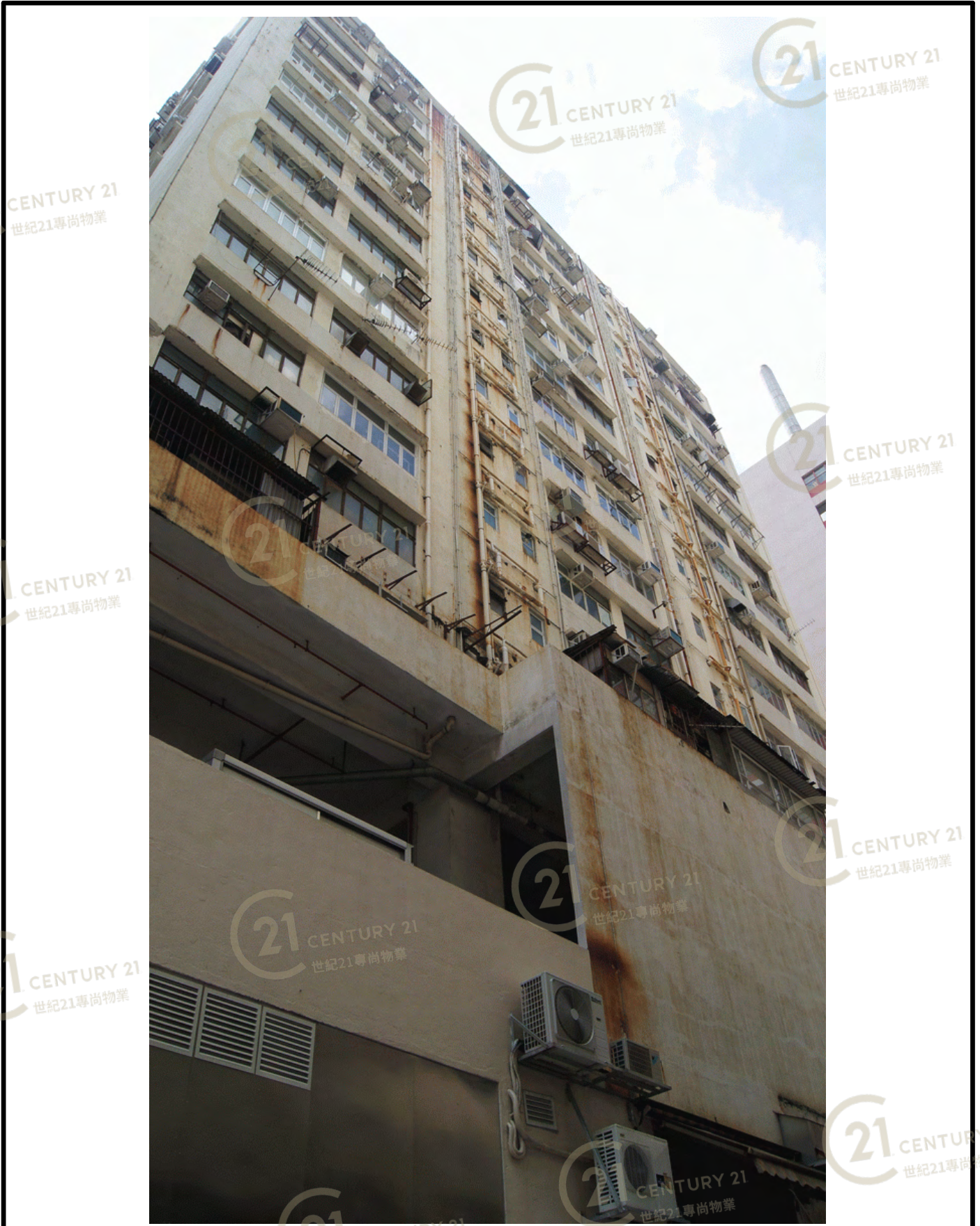
得利工業中心A座 Tak Lee Industrial Centre A

NOT TO SCALE, FOR IDENTIFICATION PURPOSE ONLY