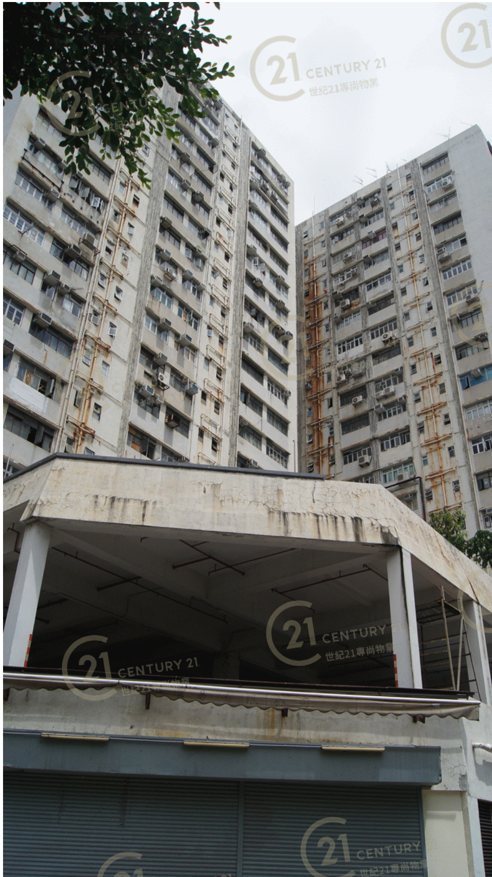
得利工業中心A座 Tak Lee Industrial Centre A

NOT TO SCALE, FOR IDENTIFICATION PURPOSE ONLY