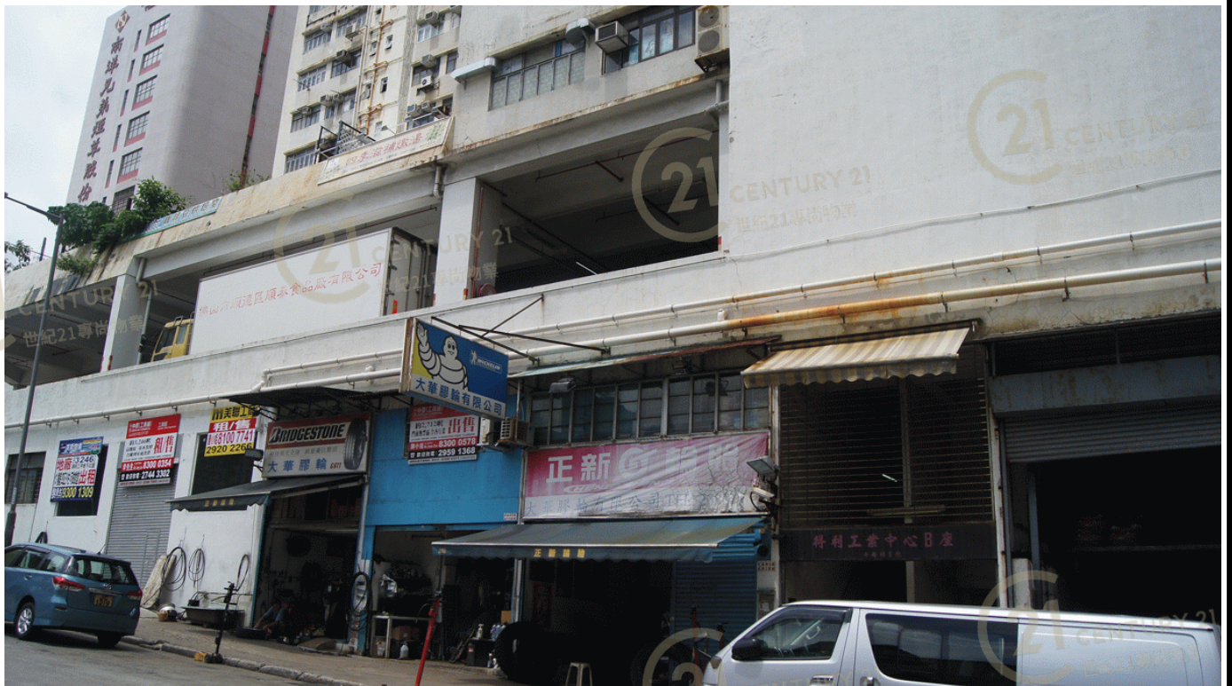
得利工業中心A座 Tak Lee Industrial Centre A

NOT TO SCALE, FOR IDENTIFICATION PURPOSE ONLY