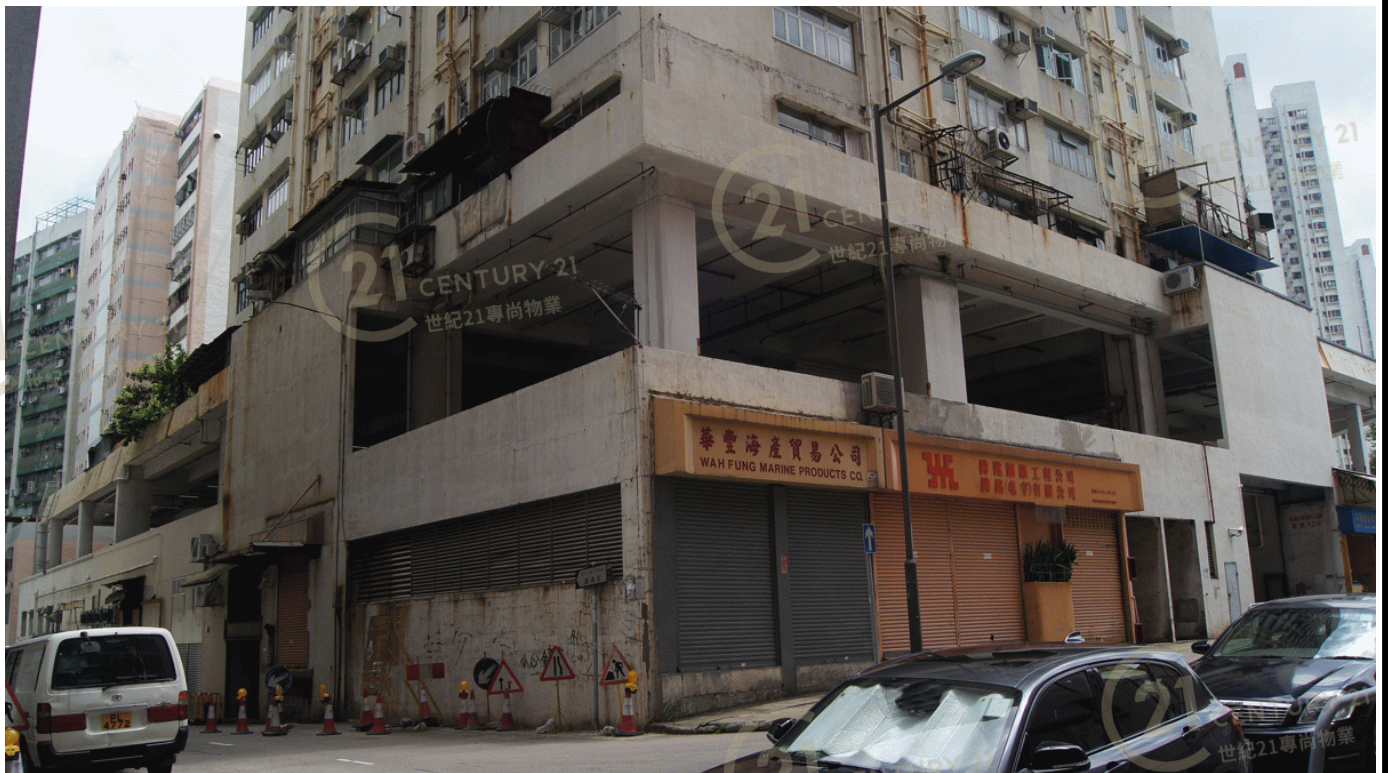
得利工業中心A座 Tak Lee Industrial Centre A

NOT TO SCALE, FOR IDENTIFICATION PURPOSE ONLY