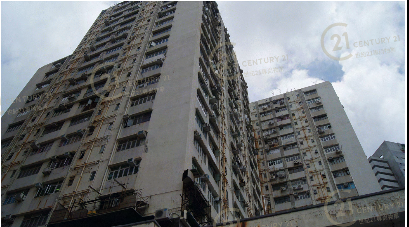
得利工業中心A座 Tak Lee Industrial Centre A

NOT TO SCALE, FOR IDENTIFICATION PURPOSE ONLY