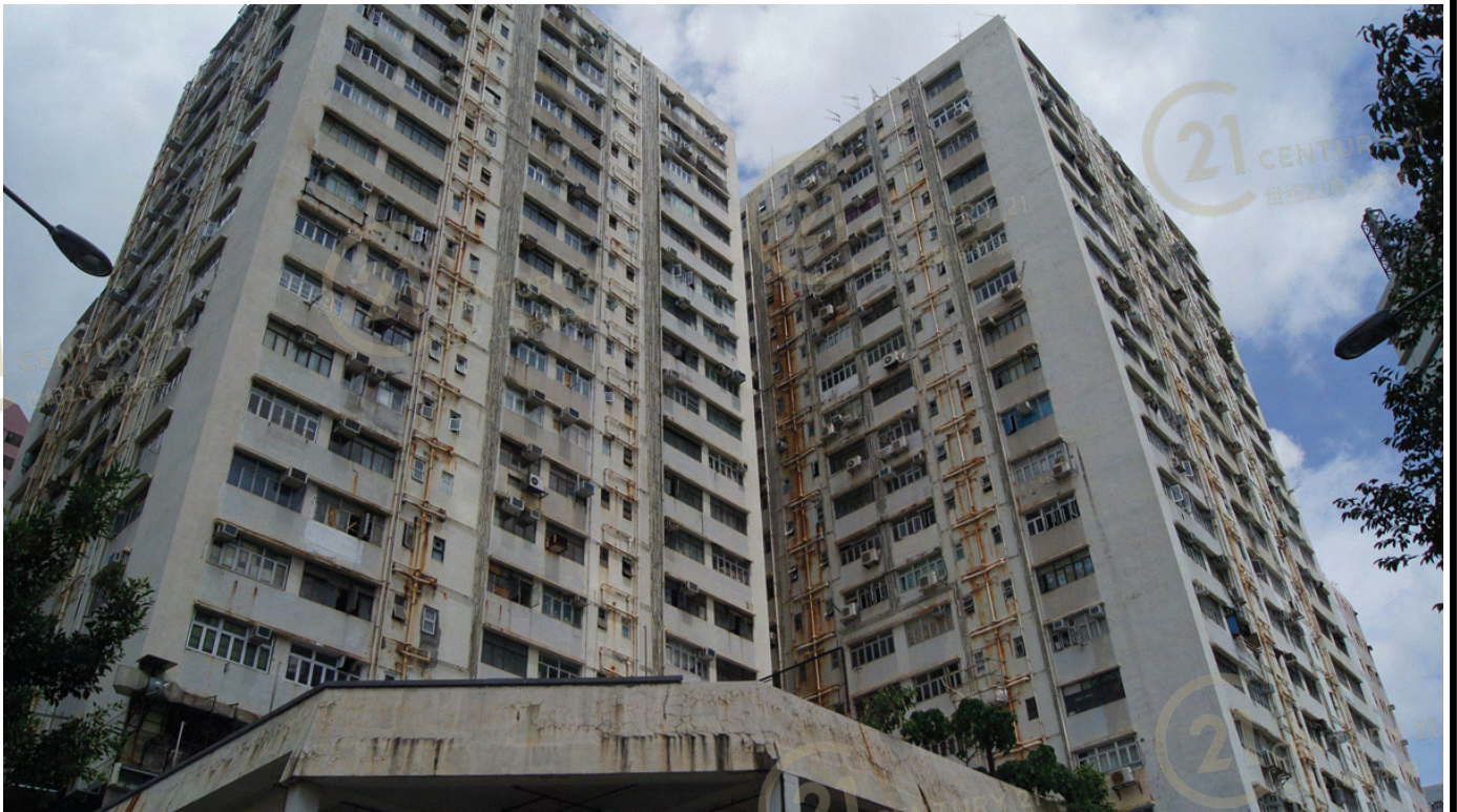
得利工業中心A座 Tak Lee Industrial Centre A

NOT TO SCALE, FOR IDENTIFICATION PURPOSE ONLY