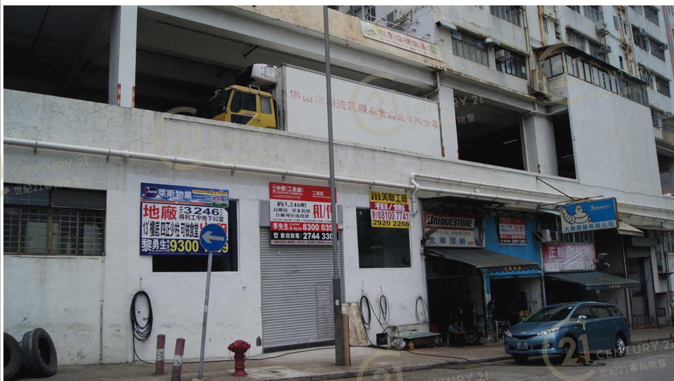
得利工業中心A座 Tak Lee Industrial Centre A

NOT TO SCALE, FOR IDENTIFICATION PURPOSE ONLY