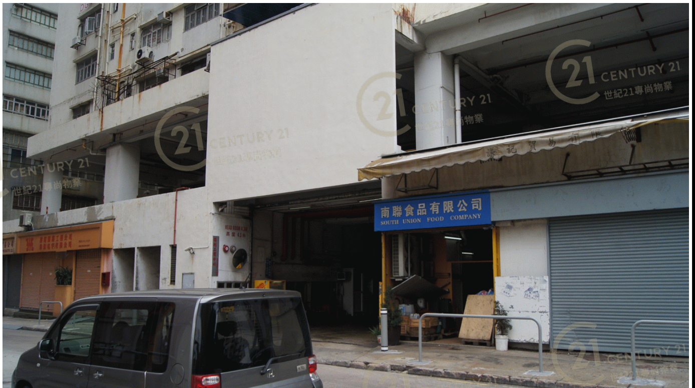
得利工業中心A座 Tak Lee Industrial Centre A

NOT TO SCALE, FOR IDENTIFICATION PURPOSE ONLY