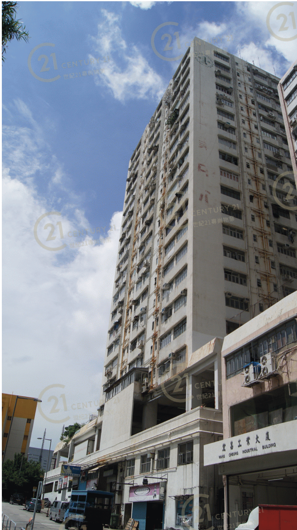
得利工業中心A座 Tak Lee Industrial Centre A

NOT TO SCALE, FOR IDENTIFICATION PURPOSE ONLY